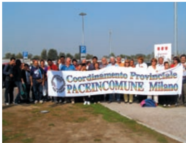
Una foto dei partecipanti locali alla Marcia della Pace Perugia-Assisi del 7 ottobre scorso

un incremento del 13,6% rispetto al precedente non sono certamente noccioline. Nel 1988 spandevamo circa 13200 MILIONI DI EURO, il 2006 si è concluso con una spesa di circa 24500 MILIONI DI EURO passando attraverso i circa 27500, cifra record raggiunta qualche anno fa, sempre MILIONI DI EURO. Come spiegare tali aumenti di spesa dopo la fine del diavolo URSS? Attendiamo ora la chiusura della gestione dell'anno in corso per conoscere l'esatto ammontare della spesa del 2007. Nel frattempo possiamo conso-