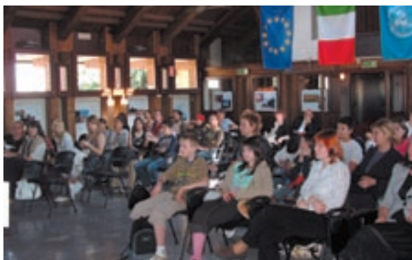
Immagini degli incontri avvenuti durante la settimana di accoglienza

Importanti sviluppi con due appuntamenti nello scorso maggio