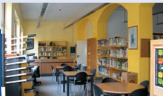
La biblioteca comunale

Nei mesi estivi è stata rinnovata e messa a norma la biblioteca comunale di p.zza Carlo Alberto Dalla Chiesa. Gli ambienti sono stati adeguati alla normativa vigente in materia di prevenzione incendi ed è stato completamente rinnovato, messo a norma e potenziato tutto l'impianto elettrico e il sistema di illuminazione, installando nuove lampade che garantiscono una migliore illuminazione degli spazi interni e condizioni ideali per la lettura. Si è pensato anche al riscaldamento dei locali, sostituendo i vecchi termoconvettori con moderni termosifoni. La tinteggiatura finale, dove predominano i toni caldi del giallo, ha infine dato un nuovo look a tutto l'interno, creando un ambiente piacevole e accogliente, pensato per la lettura ed il relax. L'attenzione all'ambiente si è concretizzata con la scelta di