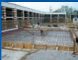
Avvio del cantiere per i nuovi loculi

Nei primi giorni di settembre hanno preso il via i lavori per la realizzazione dei due nuovi corpi loculi nel Cimitero comunale. Un primo blocco di 70 loculi sono già stati messi in vendita.