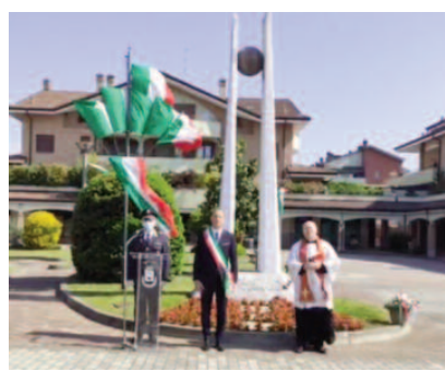
La celebrazione del 25 Aprile

società appaltatrice del servizio presso l'ente, iniziative per i bambini a casa e di sostegno psicologico per gli adulti. Inoltre, grazie al contributo volontario di due cittadi-