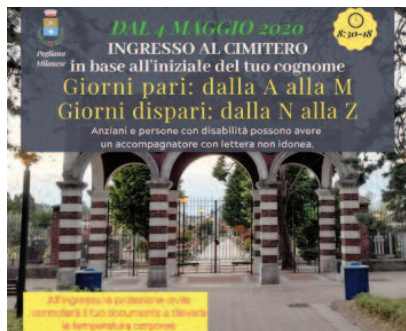
Il cimitero è stato riaperto il 4 maggio, con ingresso contingentato e a giorni alterni secondo l'iniziale del cognome

Il Comune di Pogliano ha mostrato la sua efficienza anche all'inizio della "Fase due": è stato tra i primi a riaprire il mercato, il 4 maggio, dopo che era stato, per scelta, tra gli ultimi a chiuderlo; sempre il 4 maggio è stato riaperto il cimitero , dalle ore 8,30 alle 18, con ingresso contingentato e a giorni alterni secondo la lettera iniziale del cognome (giorni pari dalla A alla M, dispari dalla N alla Z); prima dell'ingresso, con l'ausilio della Protezione Civile, avveniva il controllo della temperatura e dei documenti. Prima della riapertura, ancora in aprile, il cimitero era stato pulito da alcuni operai della ditta che lo ha in gestione, coadiuvati da Sindaco, Assessori, consiglieri delegati e da alcuni volontari. Come gesto di rispetto, su ogni tomba era stato la-