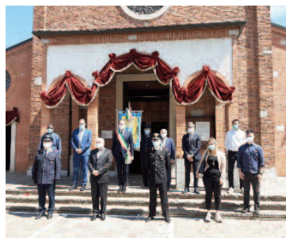
24 maggio: celebrazione eucaristica in onore di Santa Rita da Cascia

società appaltatrice del servizio presso l'ente, iniziative per i bambini a casa e di sostegno psicologico per gli adulti. Inoltre, grazie al contributo volontario di due cittadi-