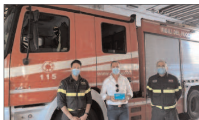
Mascherine dal Comune anche ai Vigili del Fuoco

Innanzitutto l'Amministrazione ha saputo rispondere all'emergenza con grande tempestività. Basti pensare alle mascherine, che per parecchie settimane sono purtroppo rimaste "oggetti misteriosi" per tanti, in tutta Italia, e la cosa ha riguardato anche chi ne avrebbe avuto più bisogno, ad iniziare dal personale sanitario.