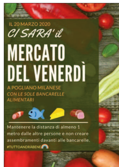
Il mercato del venerdì è rimasto aperto anche in marzo, con le sole bancarelle alimentari e le distanze di sicurezza

te non potevano assistere direttamente, e mascherine e distanza per sindaco, assessori e consiglieri - è stato deciso, con l'approvazione di alcune variazioni al Bilan-