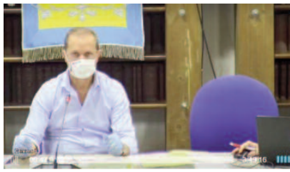
In Consiglio comunale al tempo del Covid 19

cio di previsione 2020, lo spostamento delle tasse e imposte comunali , tranne l'Imu, poiché per quest'ultima la decisione è di competenza dello Stato.