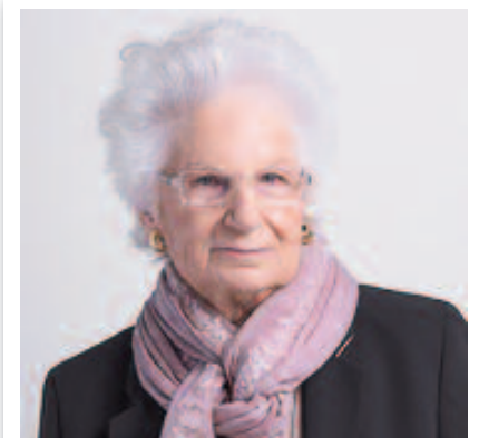
Il Consiglio comunale ha concesso la cittadinanza onoraria alla Senatrice Liliana Segre, superstita e testimone della Shoah

Inoltre, nel Consiglio comunale del 14 maggio, è stato approvato il conferimento della cittadinanza onoraria a Liliana Segre .