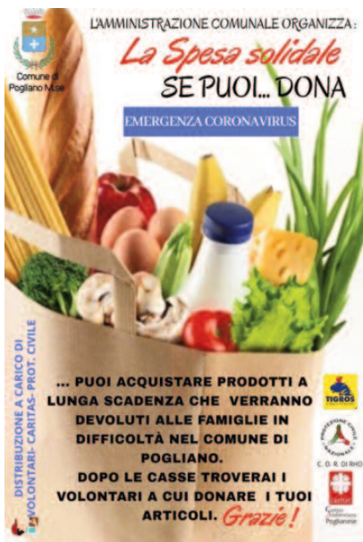
Un primo aiuto per le famiglie in difficoltà: la "Spesa Solidale"

In precedenza, il 17 aprile, il Consiglio comunale, naturalmente con le stesse modalità e misure di sicurezza, aveva approvato il Bilancio di previsione, cosa necessaria anche per avviare una serie di opere pubbliche.