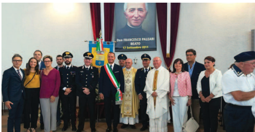
Foto di gruppo per le autorità in occasione dell'esposizione delle spoglie del Beato Francesco Paleari presso la chiesa parrocchiale di Pogliano. In alto, l'arcivescovo di Milano Mario Delpini e il sindaco Carmine Lavanga

Grazie Don Franceschino, continua a proteggere da lassù la nostra cara Pogliano.